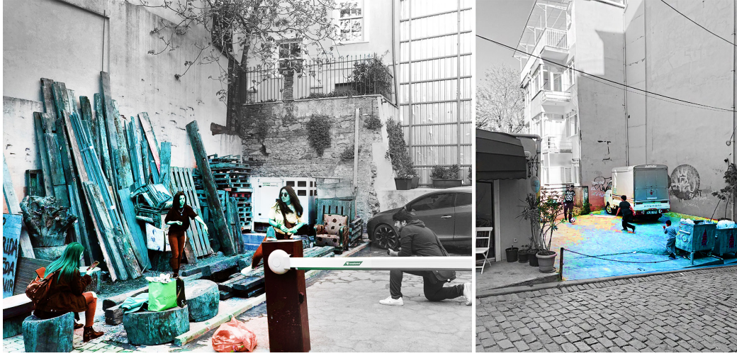
Şekil 6. Çukurcuma (sol), Beyoğlu (sağ).