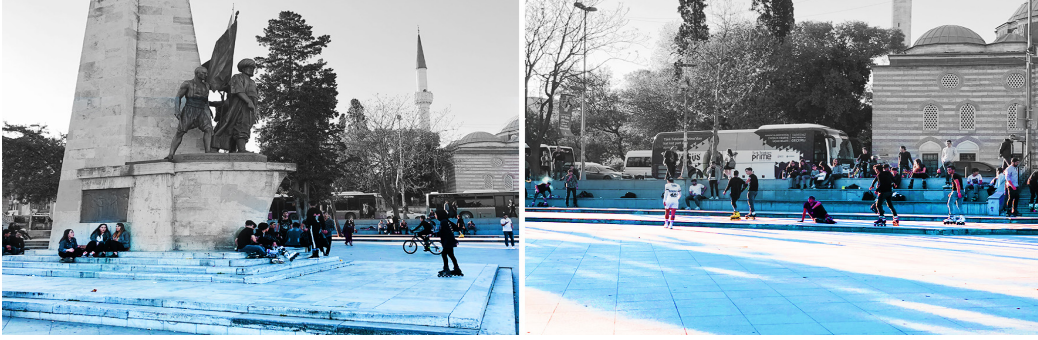
Şekil 9. Beşiktaş Barbaros Parkı Meydanı.