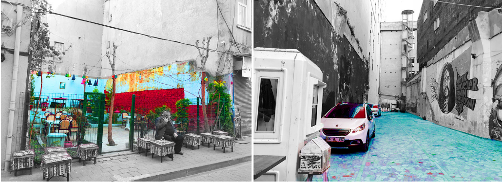
Şekil 5. Balat (sol), Karaköy (sağ).

olanı olarak kullanılan bir mekân olarak karşımıza çıkmaktadır. İncelenen örneklerden Balat'ta bulunan ve kafe bahçesi olarak kullanılan boş parsel ile Karaköy'de bulunan ve otopark olarak kullanılan boş parsellerin sınırlarının tanımlı olmasından faydalanılmakta, kontrollü giriş çıkışlara imkan sağlaması mekânların kullanımında belirleyici olmaktadır (Şekil 5). Belirli bir kullanıcı tarafından dönüştürülmüş olan mekânlar, tamamen kamusal olan kendiliğinden mekânlardan farklılık göstermektedir. Ancak özellikle Karaköy'de otopark olarak kullanılan parsel duvarında yer alan Barış Manço'nun portresi ve şarkı sözünü içeren grafiti, kentin kamusal alan istekleri konusunda bize ipuçları vermektedir: “Artık sokaklar benim görüyorsun değil mi?”.