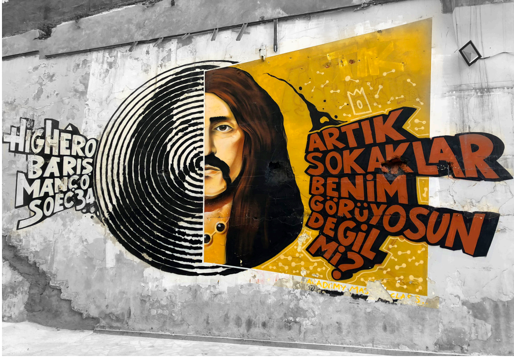
Şekil 1. Karaköy.

Avrupa yakasında Kadıköy, Anadolu yakasında ise, Şişli, Beyoğlu, Beşiktaş, Ortaköy, Balat ve Eminönü ilçeleri başta olmak üzere tamamen flanör felsefe ile belirli bir rota üzerinde olmayan yürüyüşler sonucu kendiliğinden mekânlar fotoğraflanmıştır. Yapılan gözlemler ve elde edilen veriler ile kendiliğindenlik, planlamada yer-yapma pratiğini takip eden yaklaşımlar çerçevesinde 20 yılı aşkın süredir gelişen ve halen gelişmekte olan ‘kendiliğinden şehir’ ( spontaneous city ) hareketi kapsamında belirlenmiş olan, ölçekte yerellik – yakınlaşmak, yeni gelişmelere açık olmak, kolektif değer yaratmak ve kullanıcı odaklı olmak prensipleri üzerinden tartışılmıştır. Flanör deneyiminin, alanda yapılacak gözlemler ve derinlemesine görüşmeler ile pekiştirilmesi ile rastlantısal mekânların oluşma sürecinde toplumsal yaşamın ve gündelik yaşam deneyimlerinin rastlantısal mekânların oluşmasına ve mekânın yeniden üretilmesine katkısına dair bilgi üretilmesi, ve bu bilginin tasarımın ve tasarımcının gelecekteki rolü üzerine bir tartışma platformu oluşturması amaçlanmaktadır. Bu araştırma sonucunda ortaya çıkan bulguların yalnızca fiziksel değil, toplumsal da olabilen esnek mekânlar üretilebilmesi konusunda faydalı olacağı düşünülmektedir. Kentin dinamiklerinin ve yönelimlerinin anlaşılabilmesi ile yaşanan mekâna ve kentin kendisine karşı aidiyet duygusunun kuvvetlendirilmesi konularına katkı yapması hedeflenmektedir.