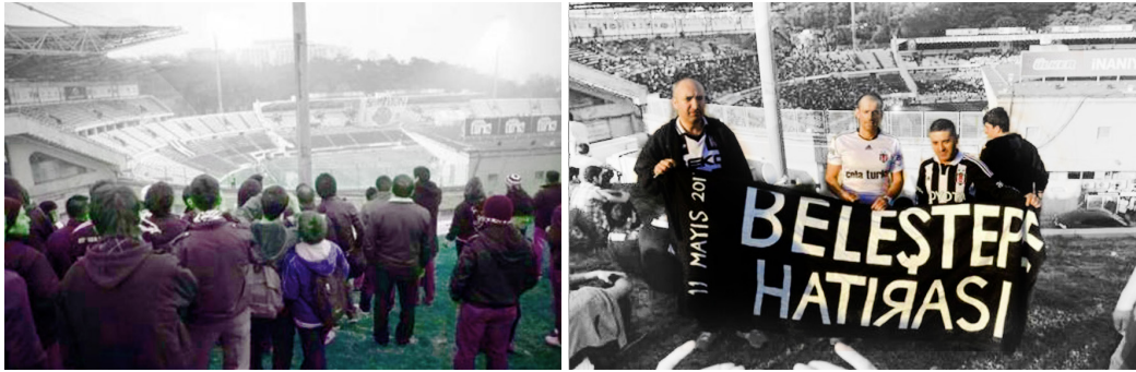
Şekil 4. Beşiktaş.

Günümüzde kaybolmuş kendiliğinden mekânlardan biri olan Beleştepe, kent için herhangi bir anlam ifade etmeyecek bir yol kenarı iken, Beşiktaş maçlarının izlenebilmesine olanak sağlayan bir yapıda olmasının keşfedilmesi ile maçların izlendiği bir seyir terası haline dönüşmüş ve yıllarca bu amaçla kullanılmıştır. Yeni yapılan stadyumun seyir için olanak vermeyen yapısı sebebiyle artık eski işlevi bulunmamaktadır. Ancak kolektif hafızada yer edinmiş bir kent mekânıdır (Şekil 4). Topografya, mekânın kullanılmasında önemli bir etken olmuştur.