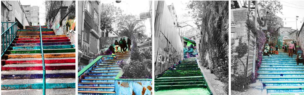
Şekil 7. Cihangir, Cihangir, Çukurcuma, Balat (soldan sağa).

‘Kolektif değer yaratmak’ ( create collective ideals ) kent mirasını korumak ve kamusal alanları geliştirmek için bir araçtır. Ortak değerler ile mekâna olan aidiyet pekişmektedir. Kolektif değer oluşturulmasında teşvik edici etkenlerden biri mekânın kamusal sanata olanak vermesidir. Kamusal sanat mekânın etkileşim alanını genişletmektedir. Bir kendini ifade biçimi de olan bu durum, bulunduğu lokasyonun hikayesini anlatmaktadır. Merdivenlerin Gezi Parkı protestoları döneminde boyanmış olması bunun bir örneğidir. Bu akım daha sonra yaygınlaşarak merdivenlerin birer kentsel taktik mekânına dönüşmesine sebep olmuştur. İstanbul’un sayısız merdiveni kentsel ölçekte bilinmekte, geçiş ve erişim fonksiyonu dışında kullanılmaktadır. Komando Merdivenleri, Haydarpaşa Merdivenleri, Merdivenli Mektep Sokak, Yüksek Kaldırım, Gezi Parkı Merdivenleri, Salı Pazarı Merdivenleri diğer kentsel ölçekte bilinen ve kullanılan merdivenler olarak sıralanabilir (Şekil 7). Cihangir Merdivenleri ise bu merdivenler arasında sosyalleşme ve buluşma mekânı olarak bilinmekte olup, bölgede yaşayanlar ve sıklıkla kullananlar tarafından kolektif bir değer ifade etmektedir (Şekil 8). İstanbul’da keşfedilen kendiliğinden mekânlardan Cihangir Merdivenleri ve Beleştepe’de kolektif bir değer oluşturmakta ve zamanla da bu değer bulunduğu bölgenin ve hatta kentin hafızasında yer edinmektedir.