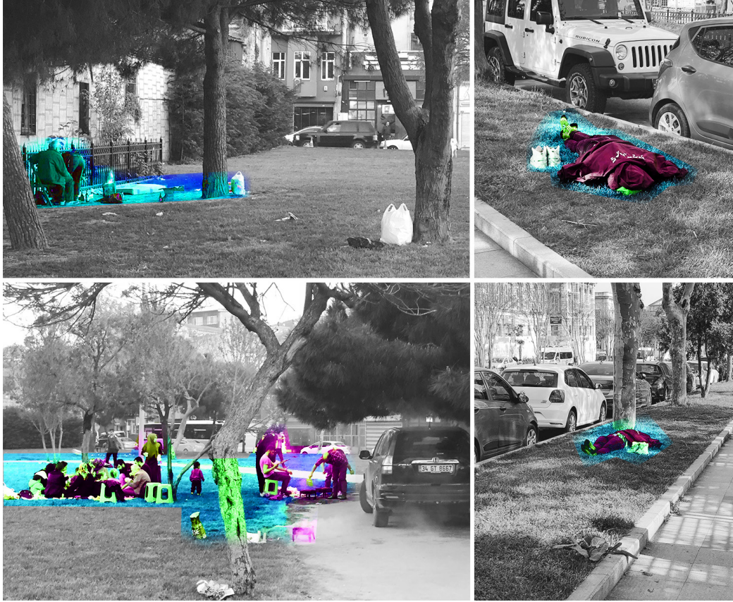
Şekil 2. Balat (sol), Maçka (sağ).

tarafından yerel ölçekte yeniden üretildiğini, ait hissedilen alanlara dönüştüğünü ve üst ölçekten bakarak göremeyeceğimiz detaylarda ihtiyaç ve isteklere göre şekillendiğini ortaya koymaktadır. Balat'ta yol kenarında yer alan yeşil alanın, yapılaşmanın yoğun, sokakların sıkışık olduğu semtin sakinleri tarafından bir kaçış yeri olarak kullanıldığı görülmektedir.