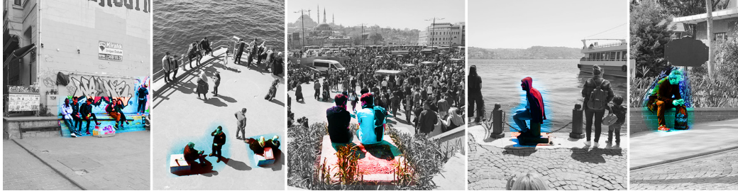
Şekil 3. Karaköy, Galata Köprüsü, Eminönü, Ortaköy, Maçka Parkı (soldan sağa).

‘Açık gelişime olanak sağlamak’ ( supervise open development ) dönüşebilir mekânlar yaratılması ile ilgilidir. Kent hem işlevleri hem de yaşam tarzı ile sürekli değişim ve dönüşüm içerisindedir. Tasarımda sürdürülebilirlik kentin bu değişimlere uyum sağlayabilmesi ile mümkündür. Doğrusal olmayan tasarımlar, mekânların canlı kalmasını sağlar. Bu sebeple tasarım, olasılıkları ve fırsatları göz önünde bulundurarak katılıma teşvik etmeli ve yönlendirici özellikte olmalıdır. Kendiliğindenlik, mekânın esnekliği ile doğrudan ilişkilidir. İstanbul’da sık gözlemlediğimiz durumlardan biri, oturma eylemine olanak sağlayan bütün noktaların, yüksek bir kaldırım, bir aydınlatma elemanı, basamaklar, kapı önleri gibi örneklerle çoğaltılabilecek pek çok kent parçasının oturma alanına dönüşmesidir. Fonksiyonundaki esneklik, bu mekânların rastlantısal birer oturma elemanına dönüşmesine sebep olmaktadır (Şekil 3).