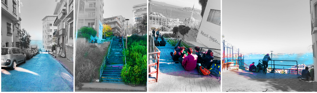
Şekil 8. Cihangir Merdivenleri.