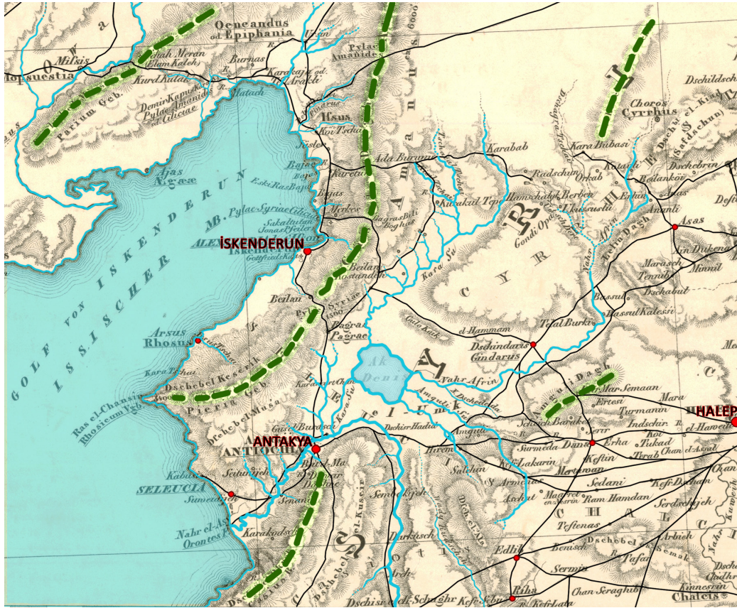
Şekil 1. 1844 Kiepert-Moltke Klein Asien haritasının değerlendirilmesi (Tezer, 2018).

Döneme ilişkin bu ilk aşama inceleme bile, kentin morfolojisi ile birlikte, teritoryalitesine ilişkin politik, ekonomik, kültürel ve toplumsal dinamizmin kaynaklarına dair somut ipuçlarının bir araya getirilebildiğini göstermektedir.