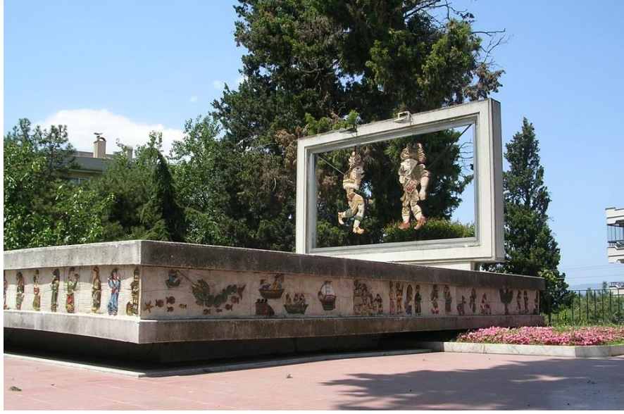
Şekil 1 Bursa, Çekirge Caddesi-Karagöz Anıtı (URL -1)