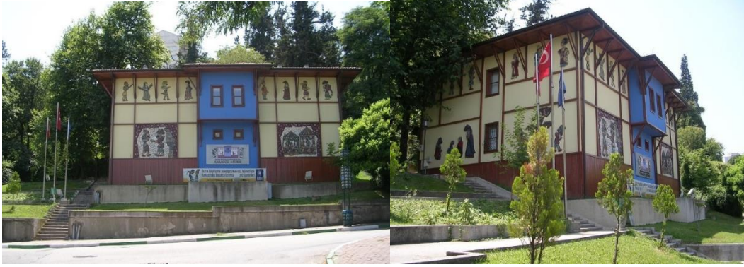
Şekil 3 Bursa Karagöz Müzesi (URL -1)

Müze, Türkiye'deki ilk ve tek Karagöz Müzesi unvanını 2023 yılı itibariyle halen korumaktadır (Şekil 3).