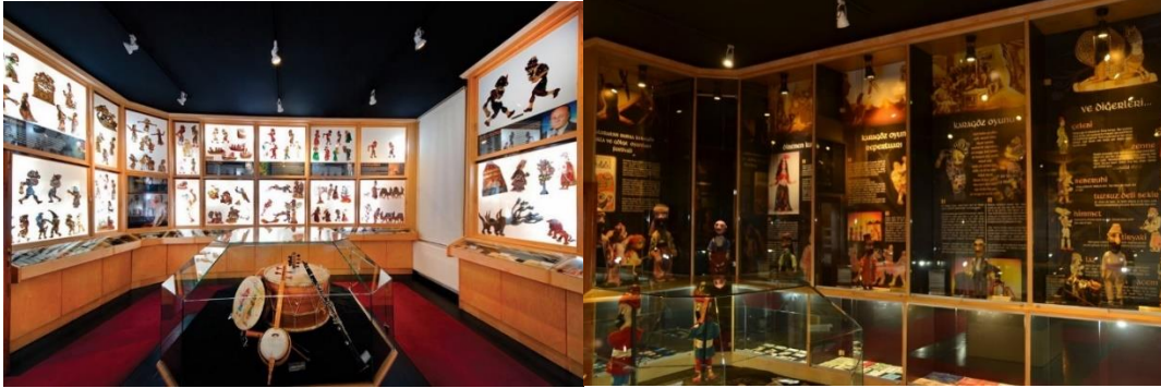
Şekil 4 Bursa Karagöz Müzesi, Karagöz tasvirleri ve kuklaları sergi alanları (URL -3)

Karagöz Müzesi, giriş kat, üzerinde bir tam kat ve bir yarım kattan oluşan, iki katlı bir yapı olarak düzenlenmiştir. İç mekan düzenlemesinde Türk Evi yapısı tematik olarak örnek alınmıştır. Giriş katta, giriş (karşılama) bölümü, ıslak hacimler ve yaklaşık 70 kişi kapasiteli bir gösteri salonu yer almaktadır. 1. Katta yer alan sergi alanları, Bursa Büyükşehir Belediyesi ve Bursa Kültür Sanat ve Turizm Vakfı'nın bağlantıda olduğu gölge oyunu ve kukla sanatçıların özel koleksiyonlarının görülebileceği özel alanlar olarak düzenlenmiştir (Şekil 4).