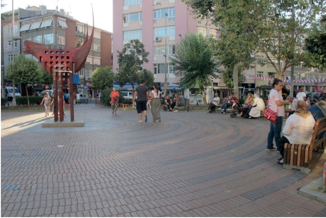
Resim 2. Mehmet Ayvalıtış Meydanı, 27 Ağustos 2014, Ebru Firidin Özgür