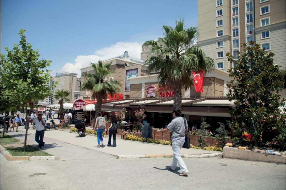
Resim 4. Ataşehir Bulvarı, yeme-içme mekanları, 7 Haziran 2013, Barış Gögüş