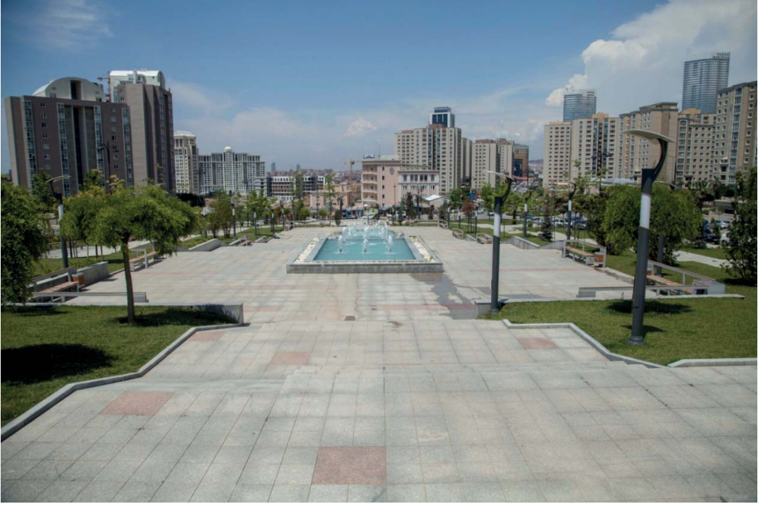
Resim 3. Ataşehir Cumhuriyet Meydanı ve Parkı, 7 Haziran 2013, Barış Gögüş