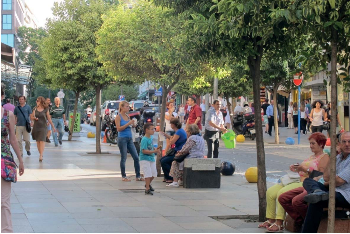
Resim 1. Bahariye Caddesi, 27 Ağustos 2014, Ebru Firdin Özgür

Karşılaştırmaya temel olarak alınan yerler Kadıköy’de Bahariye Caddesi 1 ve sonundaki Mehmet Ayvalıtış Meydanı olarak belirlenmiştir. Kullanıcı ve kullanım açısından çeşitlilik ve canlılık sunduğu izlenimi veren Bahariye Caddesi’nin karma kullanımlı olması ve çevresinde bulunan farklı ve çeşitli kullanımlar (sinemalar, tiyatrolar, kültür merkezleri, yeme içme mekânları, parklar ve çeşitli gereksinimlere hitap eden dükkânlar) insanları buraya çekmektedir (Harita 1, Resim 1, Resim 2). Buna karşın Batı Ataşehir kesiminde buna benzer bir kentsel mekân bulmak mümkün olmasa da bu açıdan en canlı görünen cadde olan ve üzerinde birkaç kafe ve restoran bulunan Ataşehir Caddesi ve bu caddeye bitişik Cumhuriyet Meydanı ve Parkı araştırma alanı olarak seçilmiştir (Harita 2, Resim 3, Resim 4). Bu alan hem Batı Ataşehir’i çevresine bağlayan ana caddelerden birisidir hem de üzerinde yoğun kullanılan yeme içme mekânları bulunmaktadır.