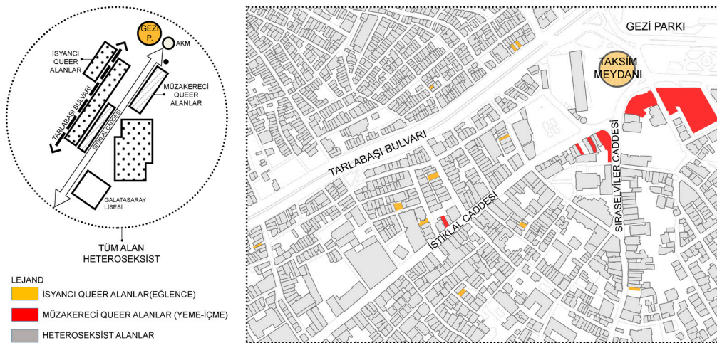
Şekil 2. Taksim kentsel mekânında cinsel coğrafya perspektifi.

Tüm bu durum özetlemesinin ışığında, cinsiyetin sekteye uğradığı bir coğrafyanın özelliklerinin ortaya konulması ve Taksim gibi baskıcı bir mekânda tercih edilmesi mekânsal arayışlar için kilit noktaları oluşturmaktadır. Çeşitliliğin oluşturduğu müzakere alanlarının morfolojik özellikleri araştırma kapsamında görünürlük, var olma, güvenlik ve tüm cinsiyet grupları arasında gerçekleşen müzakere ortamlarının varlığı üzerinden incelenmiştir. Görünürlük, LGBTTQ bireylerin mekânda tanınma ve yaşama koşullarını içermektedir. Var olabilme durumu, bireylerin mevcut cinsel kimlikleri ile özgürce bulunabildikleri mekânsal koşulları; güvenlik ise LGBTTQ bireylere karşı oluşan nefret söylemleri ve zarar görme durumlarından yoksun bir kavramı oluşturmaktadır. Cinsiyet grupları arasındaki müzakere ortamı, tüm gruplar arasındaki uyumu ve bütünleşmeyi oluşturan alanlara karşılık gelmektedir. Bu doğrultuda bütünleşik cinsellik sınırları ancak heteroseksist ve LGBTTQ ortak perspektifinde meydana gelmektedir. Herkesin kullanımına açık olan müzakere mekânları, heteroseksist mekânlar ve LGBTTQ sahipliğinde gelişen alanlar birbirinden farklılaşan özelliklere sahip olmaktadır. Tüm bu alanlar kentsel bölgeleri çatışmaya karşı müzakere için umut mekânlarına dönüştürme potansiyeline sahip olmaktadır. Bu incelemelerin doğrultusunda Taksim İstiklal Caddesi üç kentsel mekânsallıkta ele alınmaktadır. Bunlar: (i) Heteroseksist Alan, (ii) İsyancı Queer Alan, (iii) Müzakereci Queer Alandır.